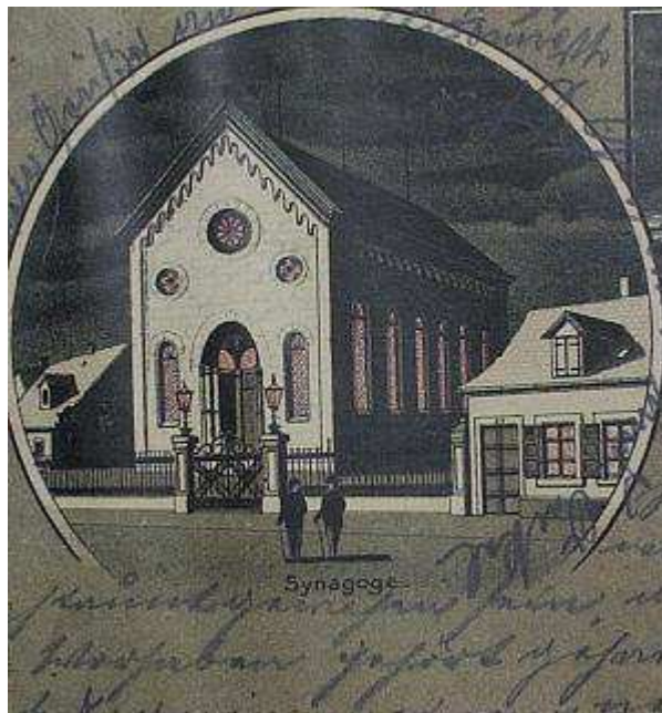
Foto: Synagoge in Frankenthal um 1900

Im Vortrag wird die Entwicklung der jüdischen Gemeinde beschrieben. Sie wurde um 1785 gegründet. Am 28. August 1885 fand die Einweihung der zweiten, größeren Synagoge in der Glockengasse 12 unter „reger Anteilnahme der Frankenthaler Bevölkerung“ statt, wie die Frankenthaler Zeitung schrieb. Im Jahr 1900, als die aufstrebende Industriestadt 16.899 Einwohner hatte, lebten hier 371 Juden, das waren rund zwei Prozent. 1933 begann die systematische Ausgrenzung der jüdischen Bevölkerung auch in Frankenthal. Viele konnten rechtzeitig flüchten. Die meisten, die in Deutschland blieben, wurden später in den Vernichtungslagern ermordet. Mit der Deportation der 39 noch in Frankenthal lebenden Kinder, Frauen und Männer am 22. Oktober 1940 nach Gurs in Südwestfrankreich endete die Geschichte der Jüdischen Gemeinde Frankenthals. Heute leben wieder Menschen jüdischen Glaubens aus der ehemaligen Sowjetunion in Frankenthal. Sie beteiligen sich am Leben der Jüdischen Kultusgemeinde Rheinpfalz und besuchen die Synagoge in Ludwigshafen.