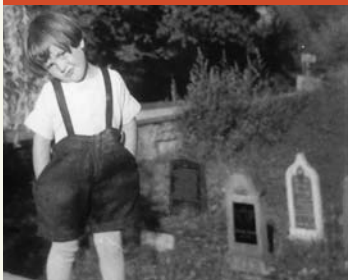
Jüdischer Friedhof vor der Zerstörung

Zeitzeuge: „Obwohl es verboten war, nahmen ein halbes Dutzend Frauen aus dem Dorf an der Beerdigung einer der letzten Jüdinnen, die hier begraben wurde, teil. Eine Bewohnerin verriet sie an die örtlichen Nazis. Strengen Verhören folgte eine Verurteilung jeder einzelnen Person zu einer Strafe von 60,- Reichsmark. Dies war eine Summe, die keine der Frauen aufbringen konnten. Später folgte eine Amnestie.“