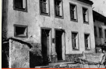
Beßlicher Str. 3