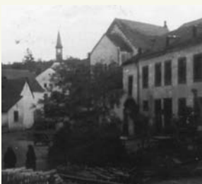
Ehemalige Synagoge heute und vor 1938