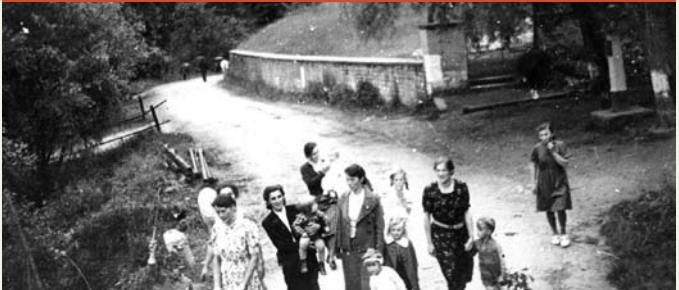
Jüdischer Friedhof ca. 1941