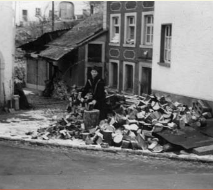
Beßlicher Str. 2

Nachbarn eingeladen. An die Hochzeiten kann ich mich nicht mehr so gut erinnern, aber ich glaube, dass die Juden auch dort eher unter sich feierten.“