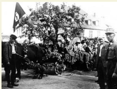
Aacher Erntedankwagen 1933 in Trier