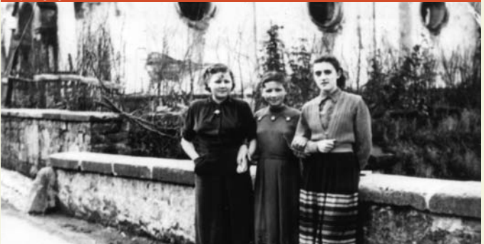
Synagoge noch mit runden Fenstern

Zeitzeuge: „Im Krieg wurde in der Synagoge alles zerstört. Die Fenster zerbrochen, das ganze Mobiliar auf die Straße geworfen. Anschließend wurde die Synagoge zum Gefangenenlager umfunktioniert, in dem serbische und französische Kriegsgefangene, die bei den Bauern gearbeitet haben, unter der Bewachung deutscher Soldaten geschlafen haben. Die Gefangenen wurden morgens zu den Leuten gebracht, bei denen sie tagsüber arbeiten mussten, und abends wurden sie wieder abgeholt und in die Synagoge gesperrt.“