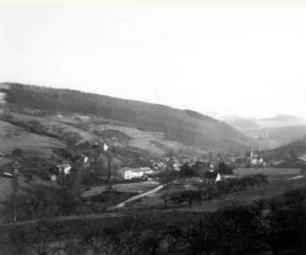
Aach vor 1940

war ebenfalls verwüstet. Mehl, Salz und Zucker, was dort in Säcken gelagert wurde, warfen sie auf die Straße. Anschließend schütteten sie Öl und Petroleum darauf, damit die Waren ungenießbar wurden und sich keiner mehr davon etwas nehmen konnte. Obendrüber in der Wohnung wurden die Federbetten aufgeschlitzt.“