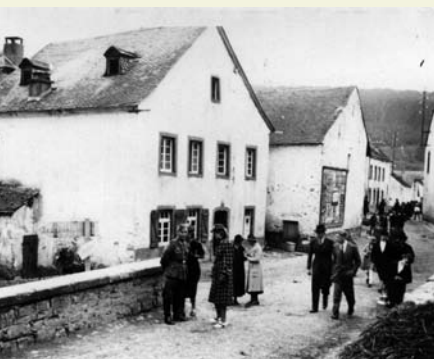
Trierer Str. 36