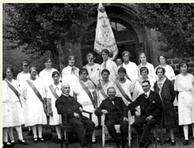
Feo bei MGv

Zeitzeuge: „Die Aacher gingen nach der ‚Machtergreifung‘ noch eine Zeit lang in die Kneipe vom Samel, bis sie von den Braunhemden öffentlich bedroht wurden.“