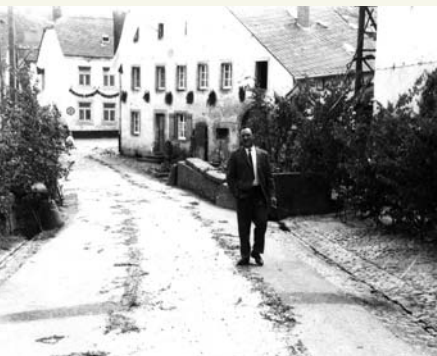
Trierer Str. 35 (hinten links)