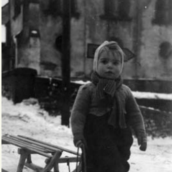
Kind vor der Synagoge