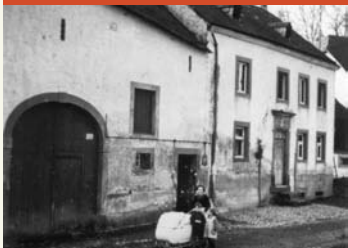
Beßlicher Str. 7