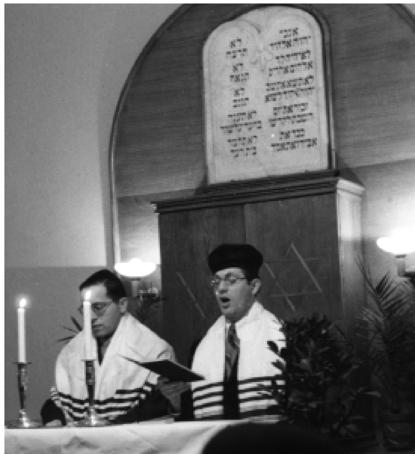
Einweihung der Synagoge in R 7, 24, 1946.