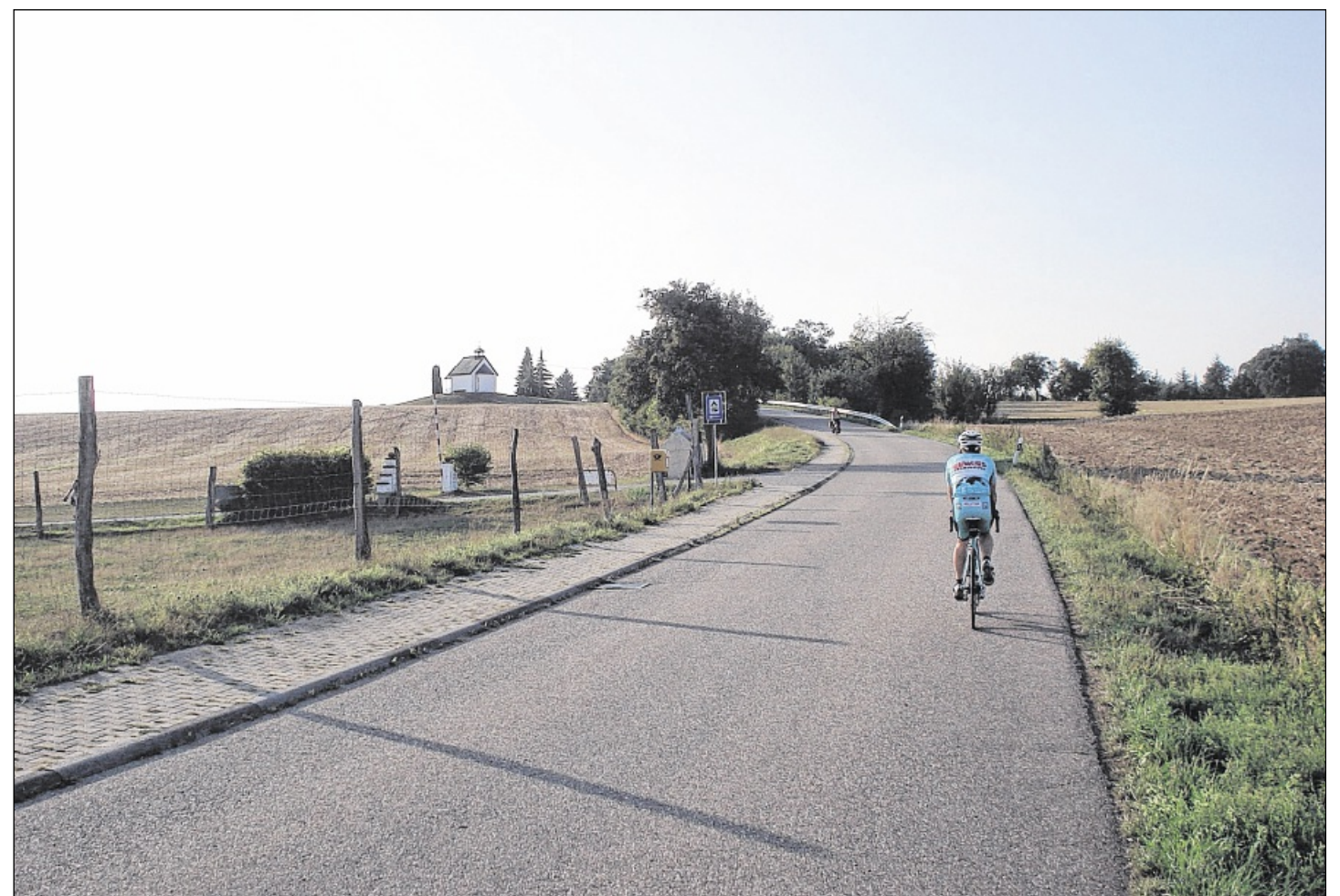
DER ANSTIEG AUF DEN SCHINDELBERG ist vielen auch vom Sparkasse Ironman Kraichgau bekannt – die Rad-Etappe des Triathlons führt unter anderem dort entlang. Auch nach der hier beschriebenen Radtour hat man sich ein Eis verdient.

Nach dem Freibad beim Ortseingang Odenheim führt die Radtour links zurück in Richtung Ortsmitte. Dort biegt man rechts in die Schulstraße in Richtung Kraichtal-Neuenbürg ein. Hier muss bereits der nächste Anstieg vorbei an der Motocross-Strecke des MSC Odenheim gemeis-